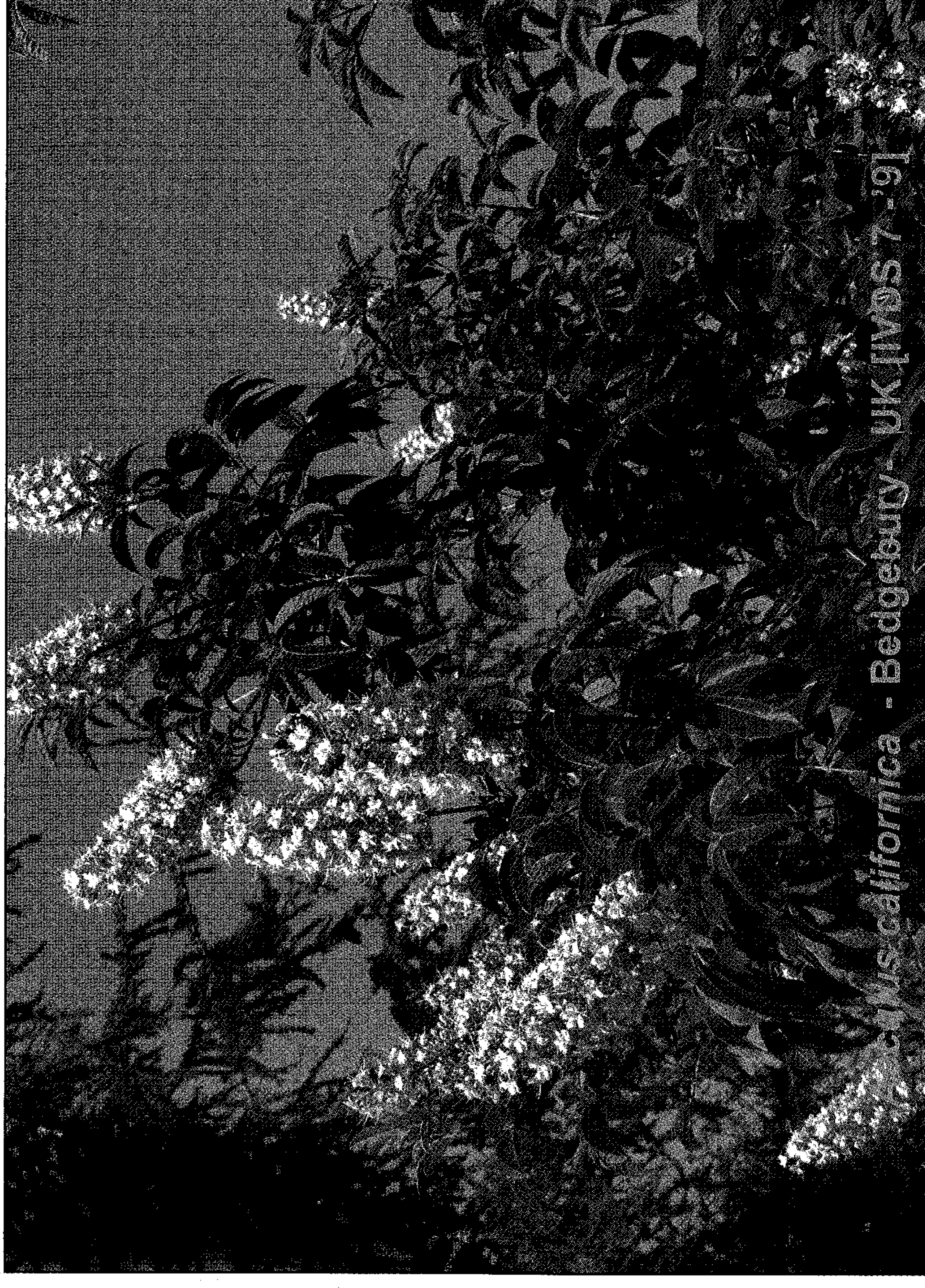
Ostrya californica - Bedgebury - UK [IVDS 7-9]